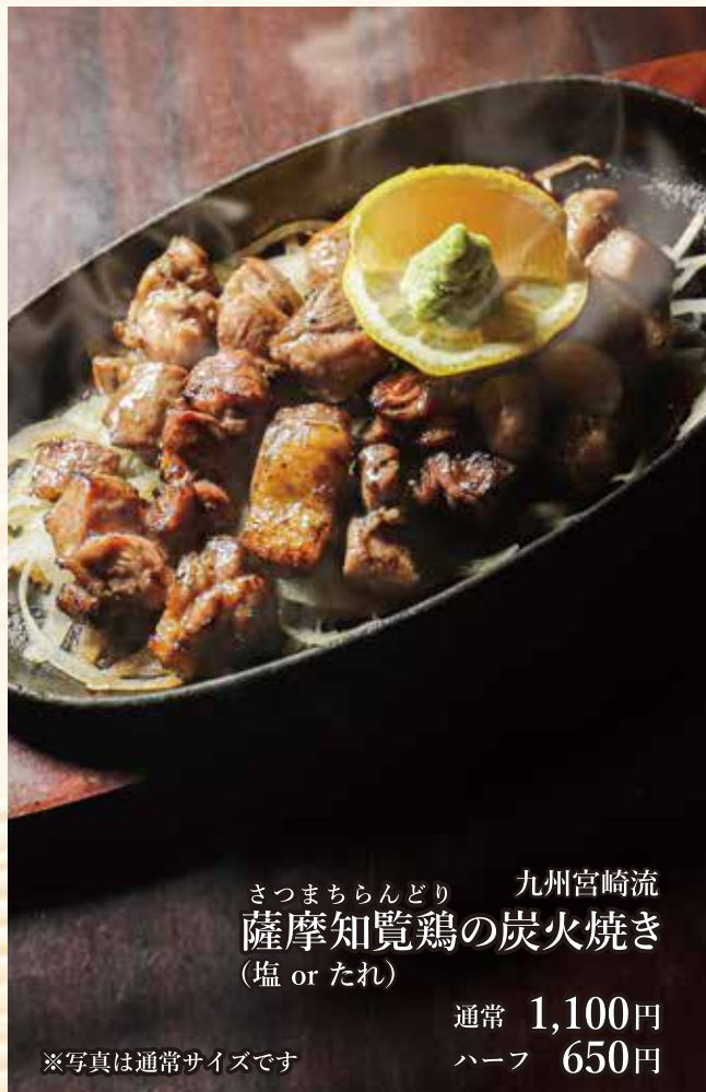
九州宮崎流 さつまちらんどり 薩摩知覧鶏の炭火焼き (塩 or たれ)