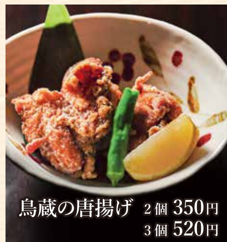
鳥蔵の唐揚げ 2個 350円 3個 520円