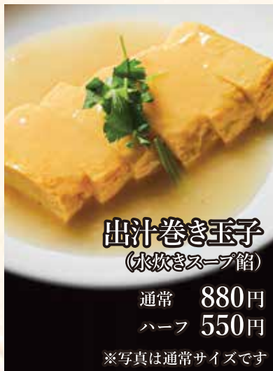
出汁巻き玉子 (水炊きスープ館)