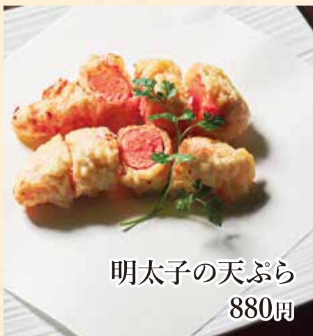
明太子の天ぷら 880円