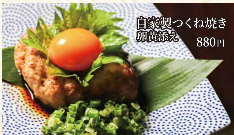
自家製つくね焼き 卵黄添え 880円