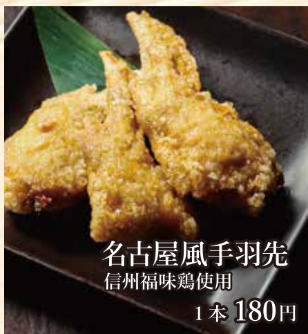
名古屋風手羽先 信州福味鶏使用 1本 180円