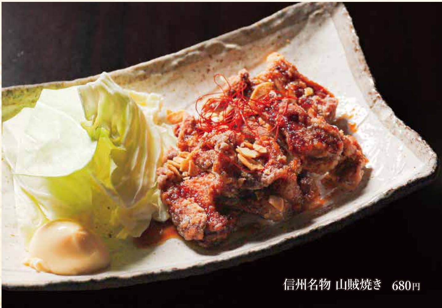
信州名物 山賊焼き 680円