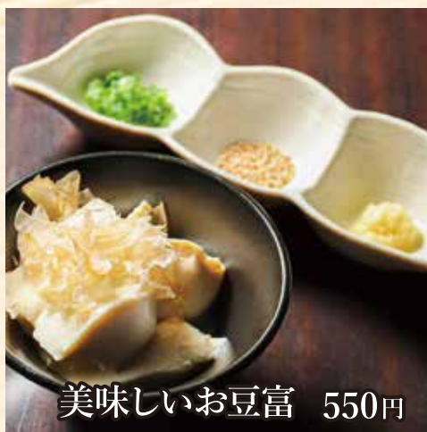
美味しいお豆腐 550円