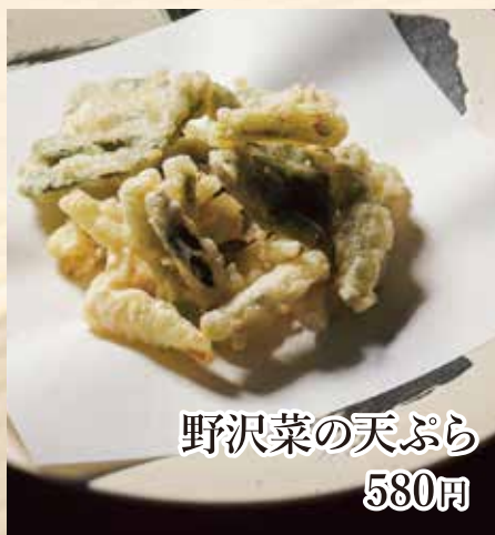
野沢菜の天ぷら 580円